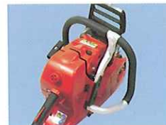
フルラップハンドル (オプション)