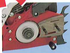
インボードクラッチと ローラーチェーンキャッチャー