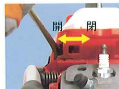
アイシング対応シャッター (冬場:開 夏場:閉)